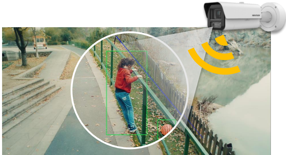
Camera (with built-in speaker)