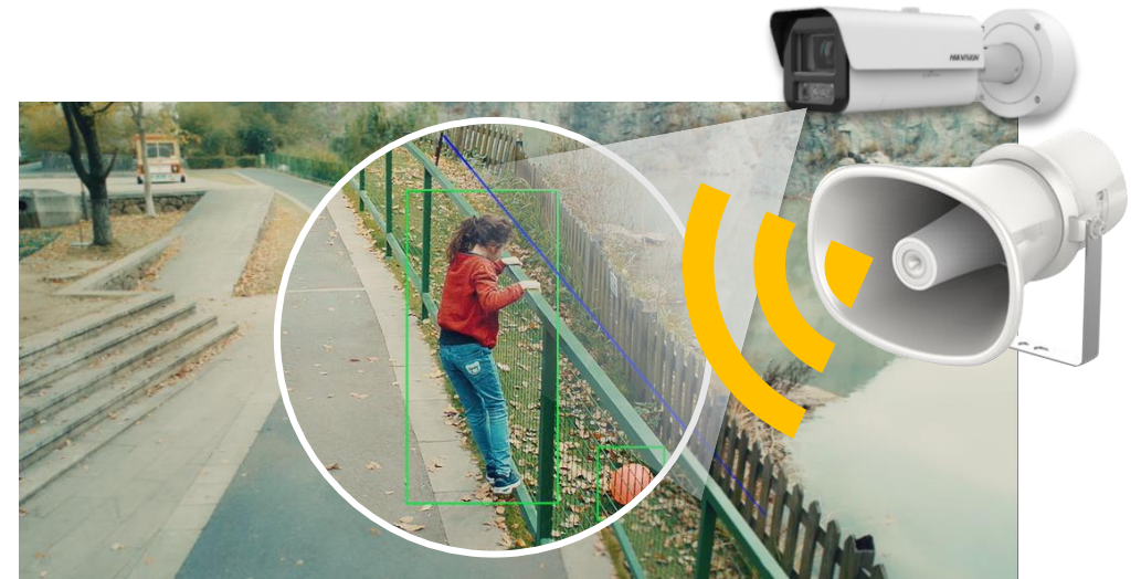
Camera + Speaker