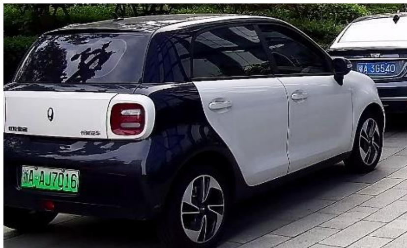
ズームアップ時 の映像