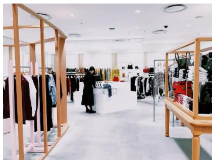
高級ブランドショップ

高級品や精密機器を扱う店舗では、来店者数と実際の購入者数に大きな差が生じることがあります。そのため、売上データだけでは把握できないマーケティング情報を得るために、人数カウントが重要です。