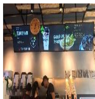
広告（POPやサインージ）の効果測定