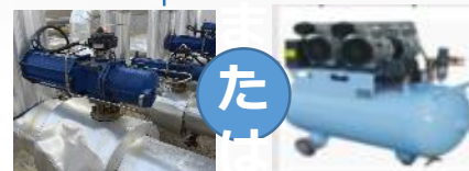
3rd パーティー用空冷マシン *