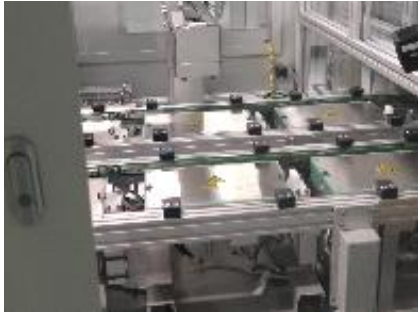
生産ラインにおける 品質の確保