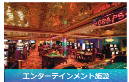
エンターテインメント施設