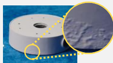
塗装されたアルミニウム合金 ブリストア発生