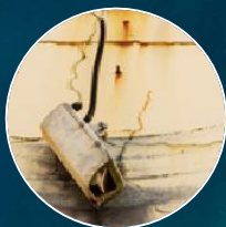
腐食による部品の脱落