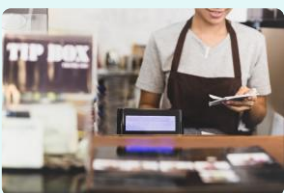
本部と遠隔で繋いで 新人研修