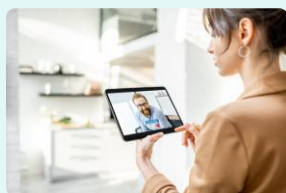
トラブル対応や専門性の高い 内容を本部に確認