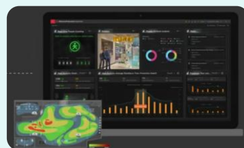
各店舗の状況を 本部スタッフが データ分析&アドバイス